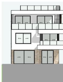
ISTOČNO PROČELJE 1:100